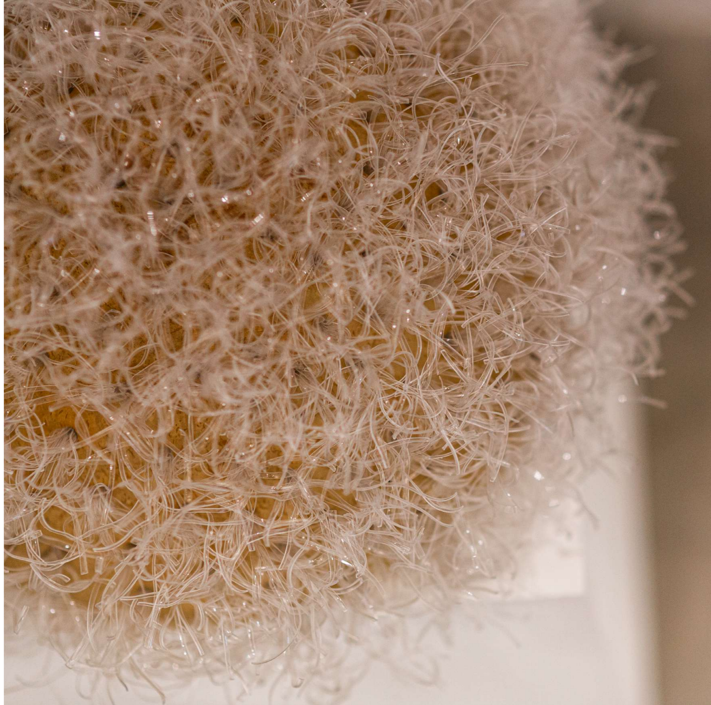
Chicoren of Gaia 2021 Plastiques et objets traditionnels Tailles diverses