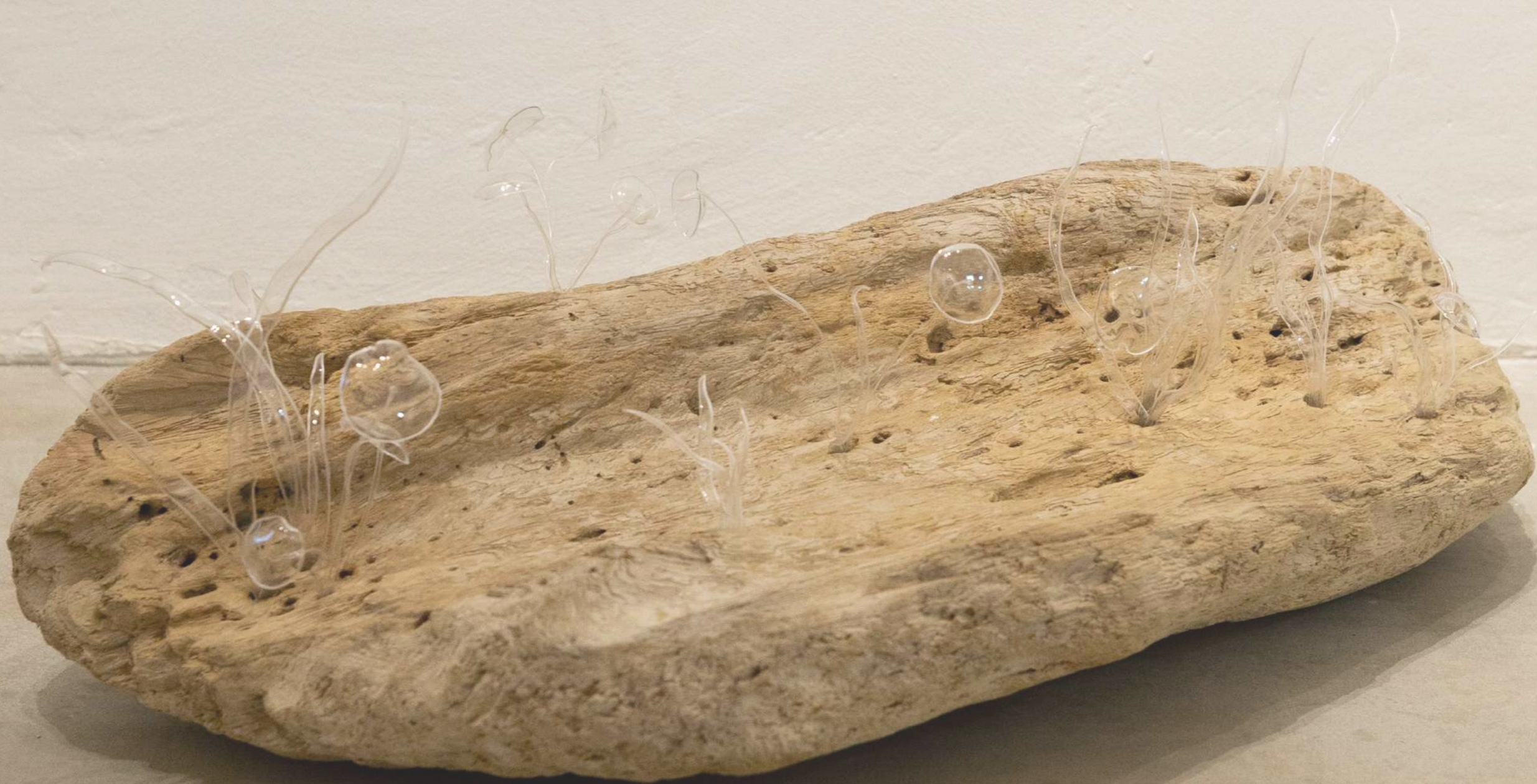
Urban garden 3 2022 Plastiques et objets traditionnels Tailles diverses