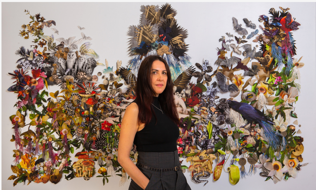
Du sommeil de la raison naissent les monstres , 2023, collage papier sur Dibon, Collection Blachère. © Odile Pascal

L'oeuvre a été réalisée durant la résidence de l'artiste à la Fondation Blachere en avril 2023.