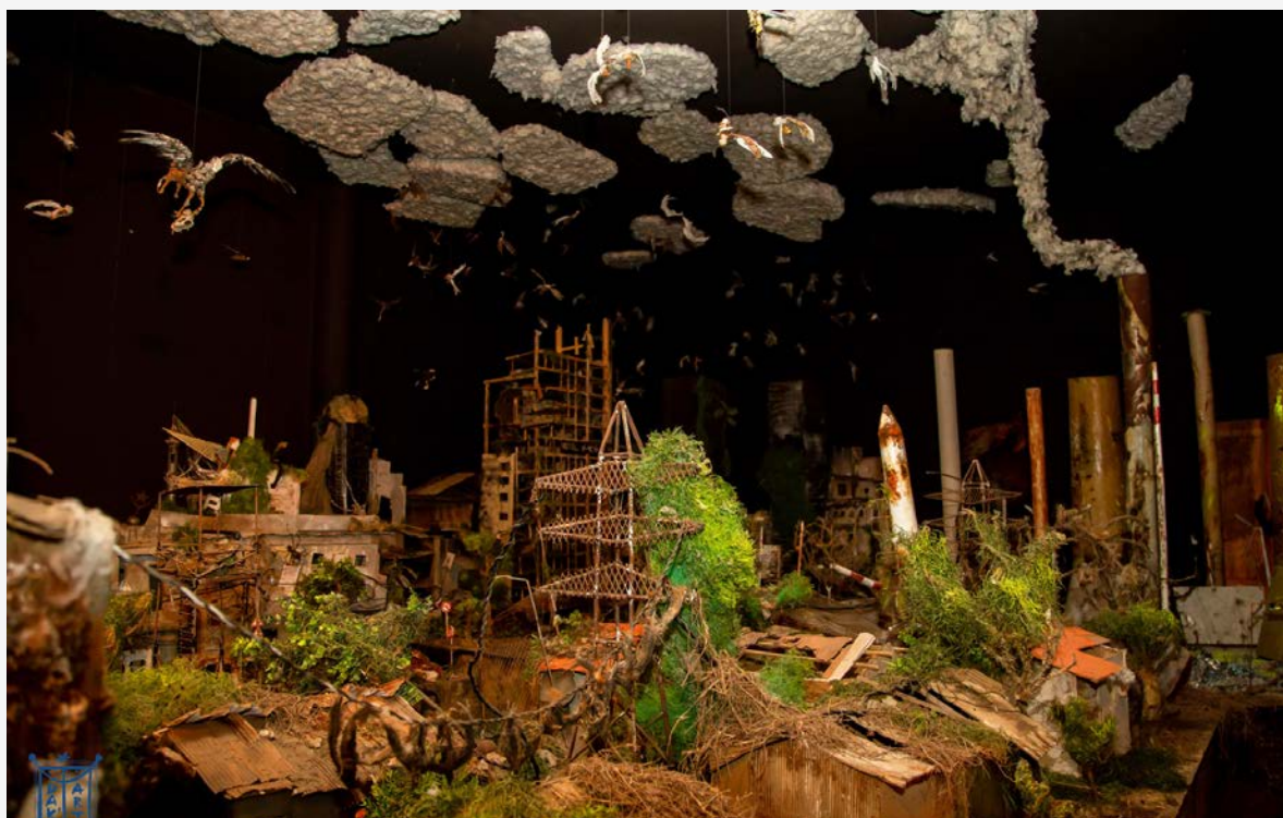
The Rusty World , 2019-22, installation, matériaux divers, Collection Blachère

“J'ai fait apparaître des créatures mythiques : certaines sont connus, d'autres me sont confidentielles. L'apparition de ces créatures dans ce monde est une révélation pour moi car j'ai toujours cru qu'il y a beaucoup de choses qu'on ne peut pas voir dans notre monde où nous vivons et qui sont pourtant présents.” Fally Sene Sow