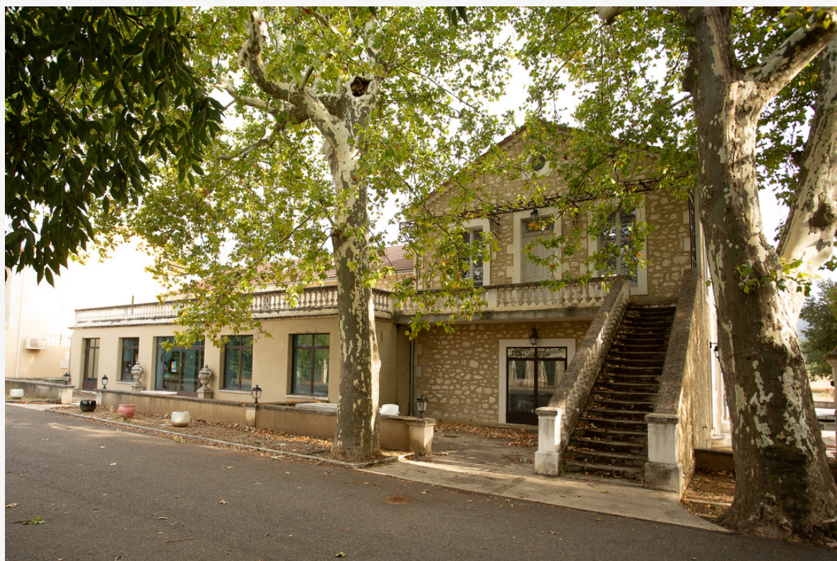
La nouvelle Fondation à Bonnieux (avant les travaux)