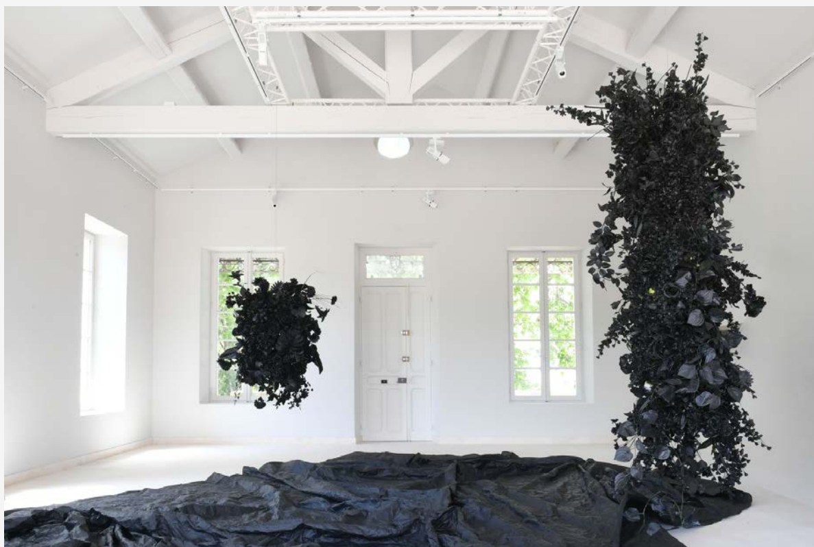
Dancing with the angels , 2021, installation, Courtesy of the artist and Sabrina Amrani Gallery. © Odile Pascal.

En 2019, Joël Andrianomearisoa a représenté Madagascar à la 58ème Biennale de Venise. Ses œuvres ont été exposées dans des institutions internationales de premier plan et sont présentes dans de nombreuses collections privées et muséales.