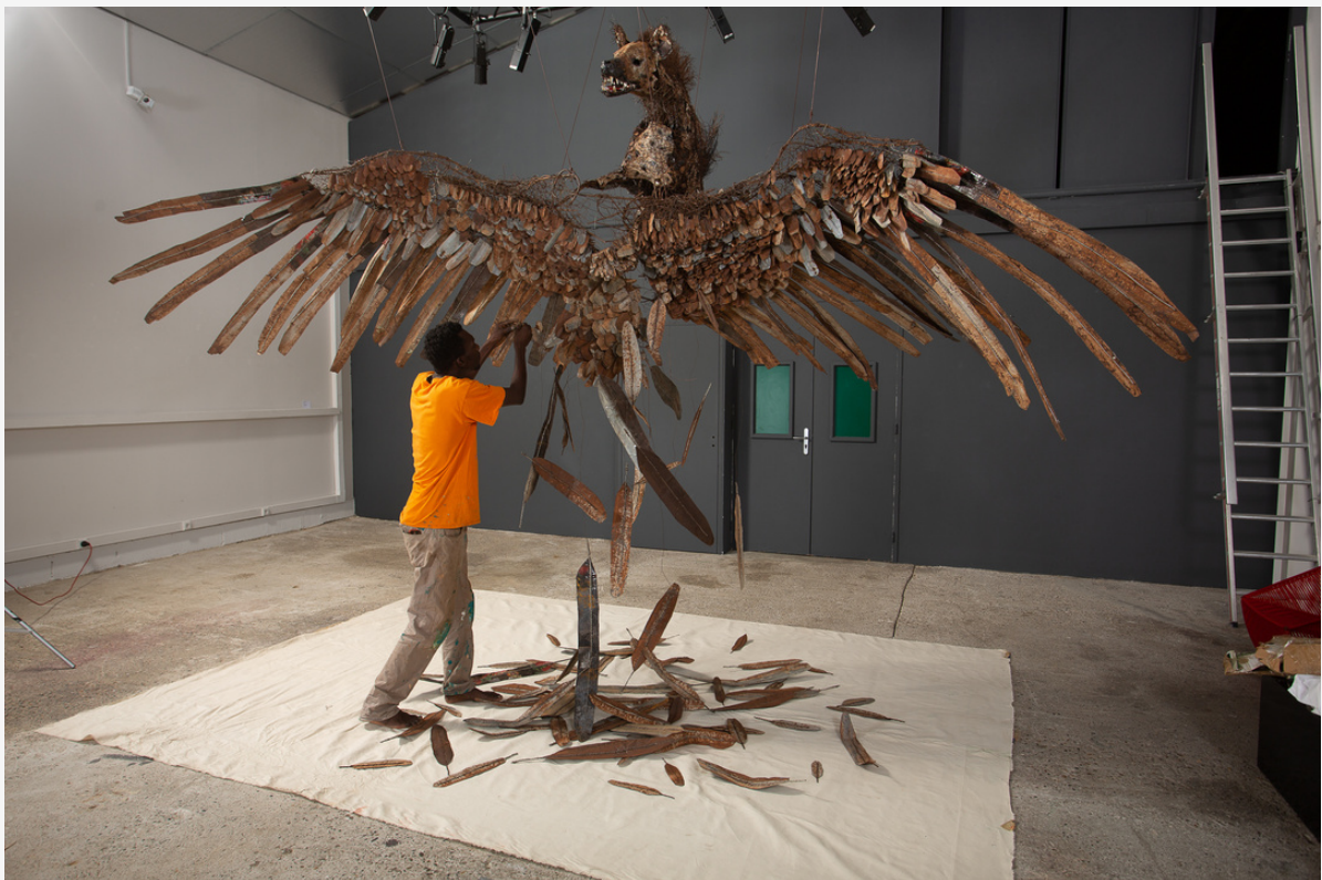
Chimère , 2021, sculpture en tôles de fer, Collection Blachère. © Jérémie Pitot

Au détour d'une discussion, il puise dans ses souvenirs pour nous parler de son enfance passée dans la région Fouta Tooro, sur les rives du fleuve Sénégal, et évoque avec tendresse et une infinie pudeur sa grand-mère qui l'a bercé de contes initiatiques peuls.